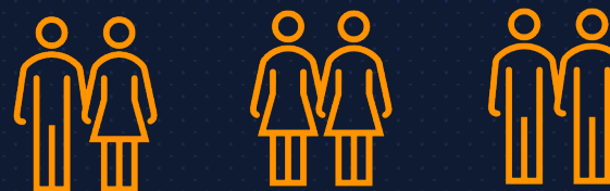
Relación de pareja pública