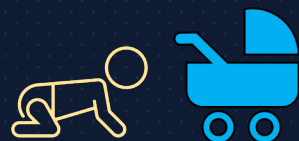
Hijo/Hija en común